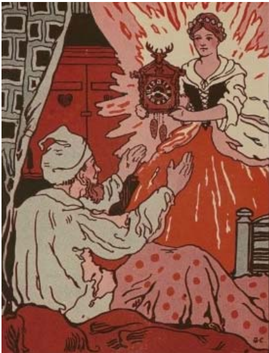
Dan hilt de Fee Kjeenijin ver sienem Blekj eene scheene Kuckuck Klock.

wiere hee un siene Fru beid emma nat to ons Fee. Äwalot am to mie. Ekj woa eene aundre Idee en sienem Kopp nenn stääkje. Fa siene Lied wääjen, woa ekj am bie brinje, daut Numma Blaut no bowe to dreie, daut Jesecht no bute to dreie, un de Henj un Finjasch em Jesecht to laje, met Rädasch benne un Jewichta unje. Dan kaun hee emma daut habe, waut hee aun disem Owent aufwacht, to doone; de Tiet saje, om Nacht un Dach.