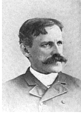
William Elliot Griffis