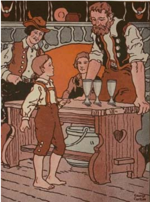
"Drinkj, junga Frint," säd de Ries, "von eent doavon."

Em ieeschten, bat toom Raunt jefeldet Glaus, wia de Jedrenkj blootroot un schumd aun de Spetz. De Dreppe, dee oppem Brat erut fluage, leete bleiwroode Plakje.