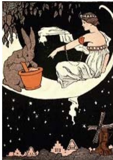
De Hos funk aun to stampe un de Medizien to moake

Waut Kjeenich Arthur fa de walische Kjinja es, es Pieet Bayard fa de Kjinja en Belgien, wiels daut Fee Pieet Bayard woat nie stoawe.