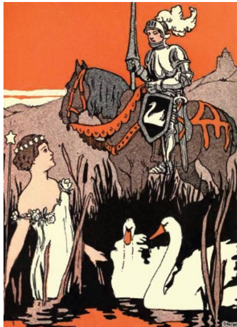
De Schwon Junkfrues un de selwana Ritta

daut Saut, de Bloom, en dän Schlope- gone-Jeschicht Goade.