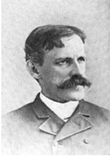
William Elliot Griffis