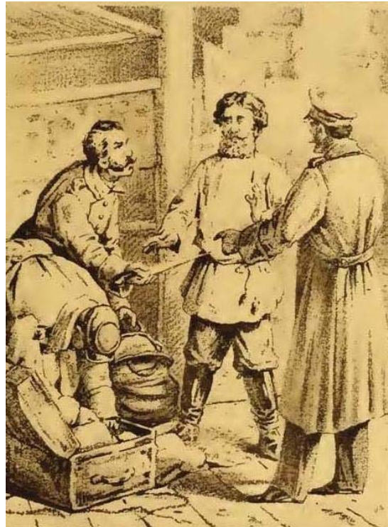
Wäm sien Massa es dit?

jeschmäte haude, bekjriezt Aksionov sikj un hield. Sien Jelt un siene Woare worde am aufjenome, un hee wort no de näakjste Staut jeschekjt un doa enjestopt. En Wladimir worde Froage betrafs sien Wäsent jestalt. De Kooplied un aundre Enwonasch von dise Staut säde, hee haud ea jedrunke un siene Tiet veschwent, oba hee wia een gooda Maun. Dan kaum de Prozass, hee wort aunjekloacht, eenen Koopmaun aus Ryazan aufjemort un am twintich dusent Rubbel jestole habe.